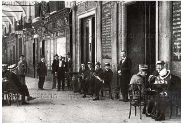
Un caffè sotto i portici del centro di Torino agli inizi del Novecento.

Sul lato destro di via Po, la seconda traversa, via Bogino , era la sede della maggior parte delle ambasciate presso il Re di Sardegna: Francia, Prussia, Austria, Russia, ecc. Al numero 9 c'è lo stabile più bello, Palazzo Graneri della Rocca, al cui piano nobile ha la sede storica il circolo degli artisti, ora circolo dei lettori, negli stessi locali dove era situato il comando militare di Torino durante l'assedio del 1706, ubicato lì sempre perché le bombe francesi non potevano arrivare.