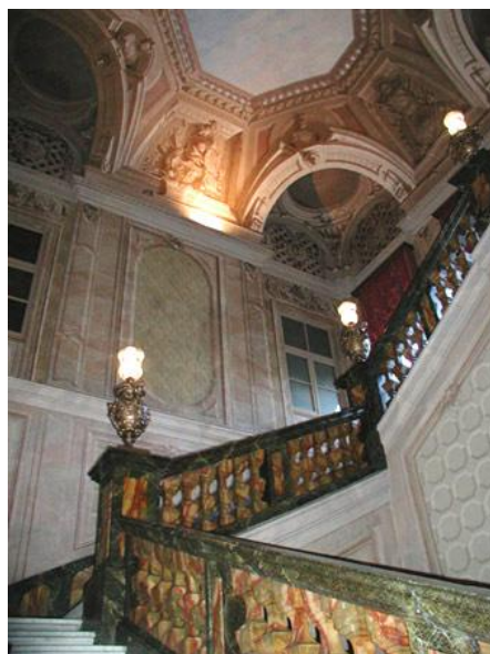
Scaloni di Palazzo Barolo

In Palazzo Barolo si trova anche la fondazione Tancredi di Barolo, che raccoglie libri e pubblicazioni per l'infanzia (l'unica in Italia) e ha costituito un “museo della scuola” per far vedere come si studiava nei tempi andati.