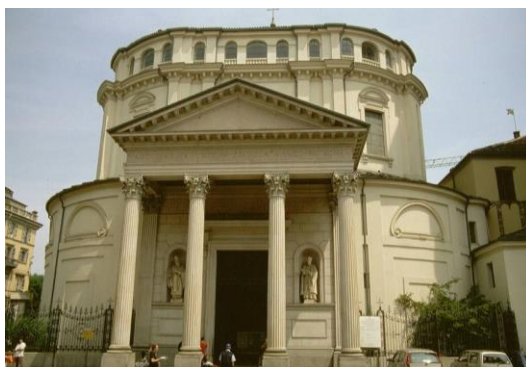
Santuario della Consolata

Nella bella piazzetta antistante, c'è un piccolo caffè con arredi dell'ottocento, celebre per la cioccolata e il "bicerin", antica colazione torinese, che dà il nome al locale