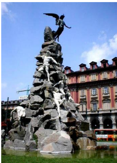
La Fontana del Fregius

non c'è proprio da stare allegri, e si capisce perché Piazza Statuto sia considerata uno dei siti di Torino magica (o)