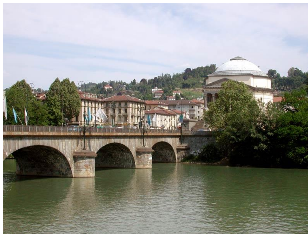
Panorama sul Po

Una curiosità sulla denominazione della chiesa della Gran Madre fatta erigere dal Comune ( e tuttora di proprietà comunale) per festeggiare il ritorno dei Savoia nel 1814, che chiude il panorama di piazza Vittorio. Nessuna chiesa al mondo tra quelle dedicate alla Madonna porta il nome di “Gran Madre di Dio” che è il titolo con cui veniva invocata Iside nell’antico Egitto. Evidentemente tra i decurioni comunali dell’epoca ce ne erano molti interessati