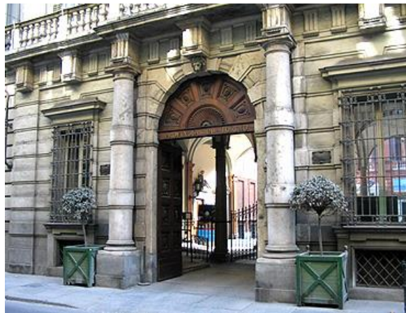
Palazzo del Pozzo della Cisterna

Al n.18 troviamo un decoroso palazzo, gemello più piccolo di quello all'angolo di via Carlo Alberto, oggi sede della Provincia, che ha un grande giardino che si chiude con un caseggiato. I due palazzi e il caseggiato facevano parte della dote dell'ultima principessa Del Pozzo della Cisterna, Maria Vittoria per l'appunto, che sposò il Duca d'Aosta, fu per qualche anno regina di Spagna e morì giovane. Il titolo di Principe della Cisterna era connesso a un piccolo feudo in provincia di Asti, però feudo pontificio (era pontificio anche il principato di Masserano, i cui cadetti erano i La Marmora), perché, in uno stato il cui sovrano era un Duca, non potevano esserci sudditi principi. I Dal Pozzo discendevano da un illustre giurista, e in quanto feudatari dei Savoia, erano anche marchesi di Voghera e conti di Neive. Grazie anche ai feudi in Canavese, erano la famiglia nobile più ricca del Piemonte. Il che non toglie che l'ultimo principe, padre di Maria Vittoria venisse condannato a morte per la partecipazione ai moti del 1821, ma riuscì a scappare in esilio per un bel periodo.